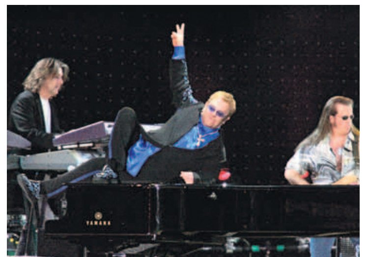
Виртуозное владение инструментом Элтон Джон продемонстрировал всем телом

Сэр Элтон на этот раз предпочел стильный аскетизм: концерт, посвященный борьбе с ВИЧ/СПИДом, не предполагал красочных декораций. На сцене — черный рояль и монитор. За ударными, всевозможными барабанами, трещотками и маримбамми, как в старые 70-е, вдохновенно работала Найджел Олсон, на лид-гитаре — Дэви Джонсон, а за клави-