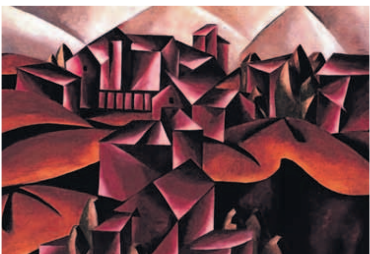
«Вид Бирска» Любови Поповой стал топ-лотом аукциона MacDougall's

У MacDougall's на сей раз была большая коллекция, так что пришлось не только перебраться в другое помещение (которое теперь и будет постоянной резиденцией дома), но и разбить коллекцию на две части (о первых результатах торгов «Б» писал в субботу). Современная шла второй, хотя заслуживала быть первой. Цены на нонконформистов-шестидесятников невысоки (в сравнении с живописью первой половины XX века), но по всему видно, что именно они и будут расти в первую очередь. И уже растут. Хотя рекорд в $1 млн на живопись