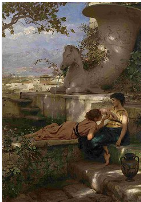
Генрих Семирадский. "Новый браслет", около 1883 года. Эстимейт £250-300 тыс.

Государственный центральный музей современной истории России, 14-22 мая (включая "ночь музеев" 14 мая)